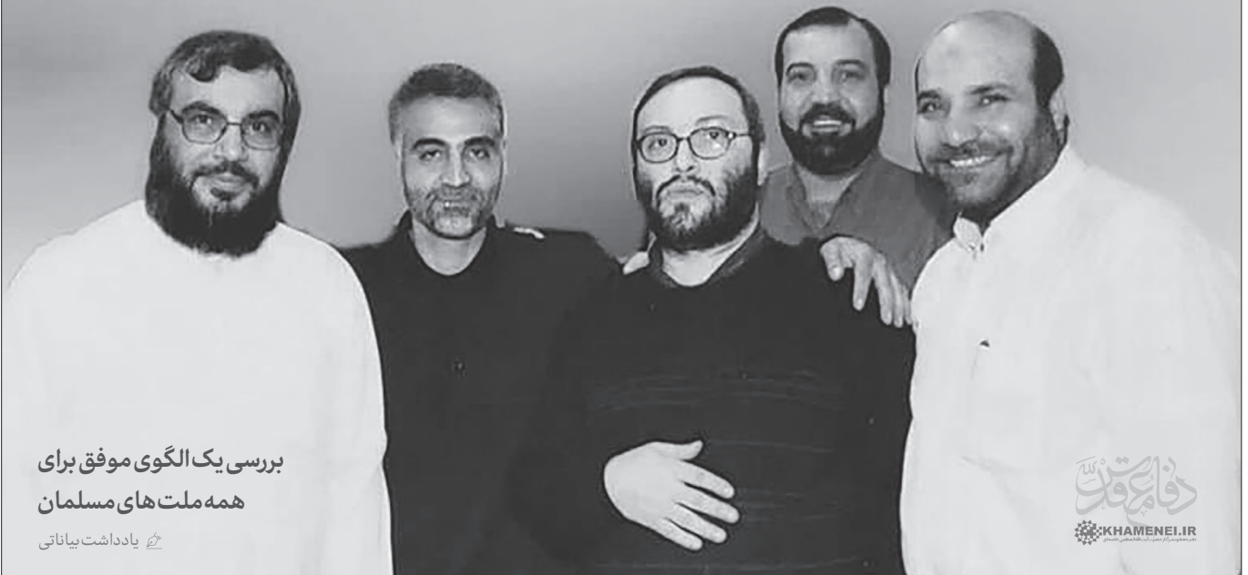
بررسی یک الگوی موفق برای همه ملت های مسلمان یادداشت بیاناتی